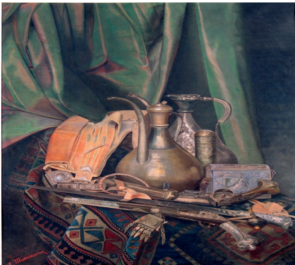
Foto nr. 7. Arme bosniace.