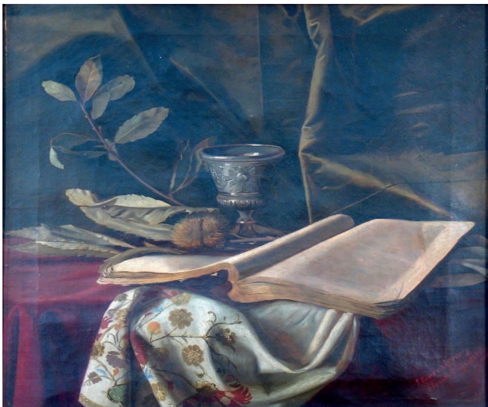
Foto nr. 8. Natură statică.